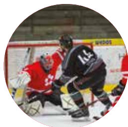
HOKEJOVÝ ZÁPAS JU x VŠTE