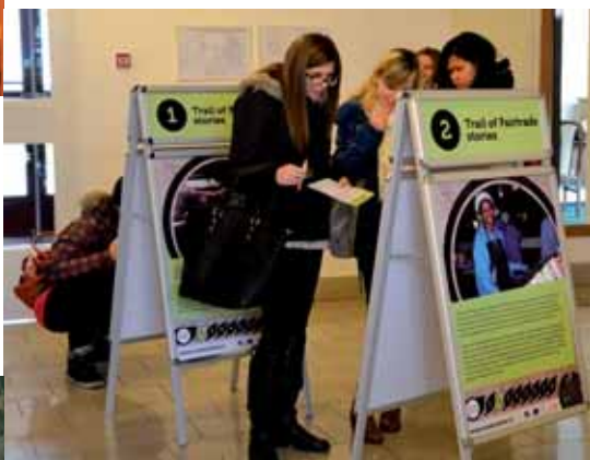
> Zájemci o studium na Ekonomické fakultě si mohli zasoutěžit na stezce příběhů Fairtrade. Náplní jedné z aktivit bylo určování plodin z informačních tabulí. Návštěvníci tak odcházeli nejen s vědomostmi, ale i fair trade čokoládou v kapse.