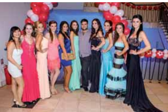
Finalistky prvního ročníku Miss JU