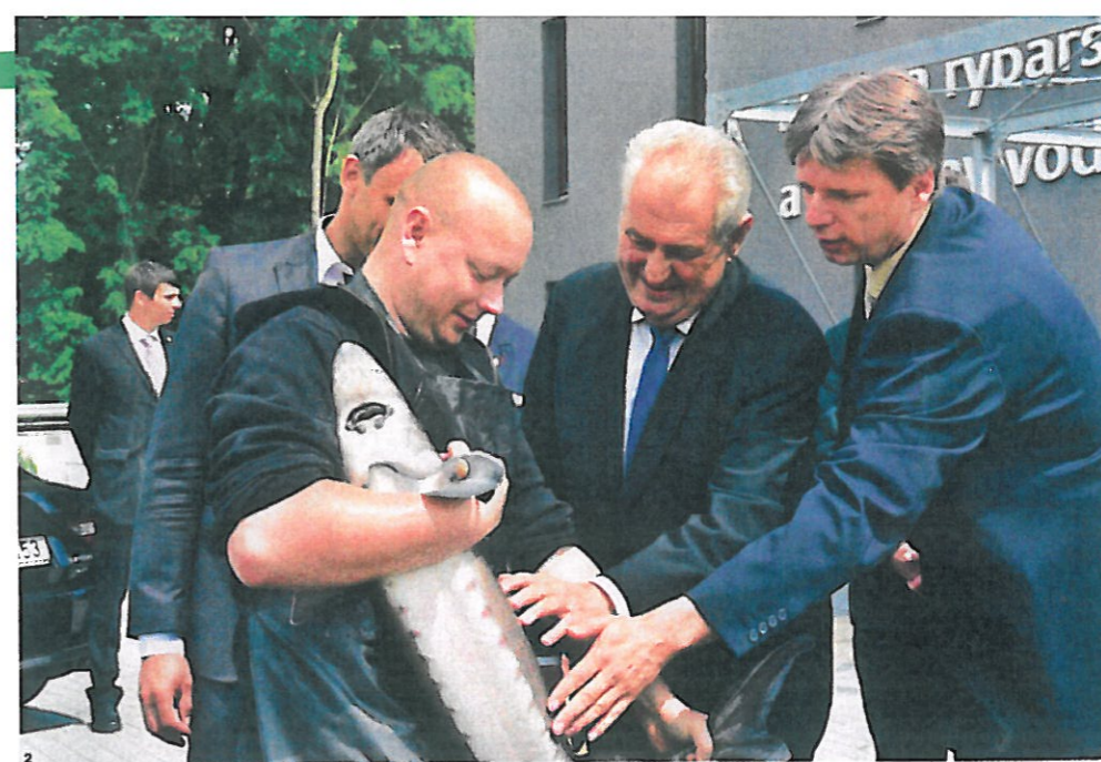
▲ POHLADIL SI JESETERA. Školu navštívil i prezident republiky Miloš Zeman. Ocenil zdejší pedagogy a vědecké úspěchy.

Děkanem Fakulty rybnářství a ochrany vod Jihočeské univerzity v Českých Budějovicích je již od jejího založení v roce 2009. Letos v říjnu mu končí druhý mandát, funkci již nemůže obhajovat. Vystudoval Vysokou školu zemědělskou v Brně, specializace rybnářství. V roce 2006 byl jmenován profesorem v oboru zootechnika. Působil v zahraničí, například ve Francii či Singapuru. Ve významné vědecké databázi Web of Science má zařazeny již takřka dvě stovky publikací. Je ženatý, má tři děti a jedno vnuče.