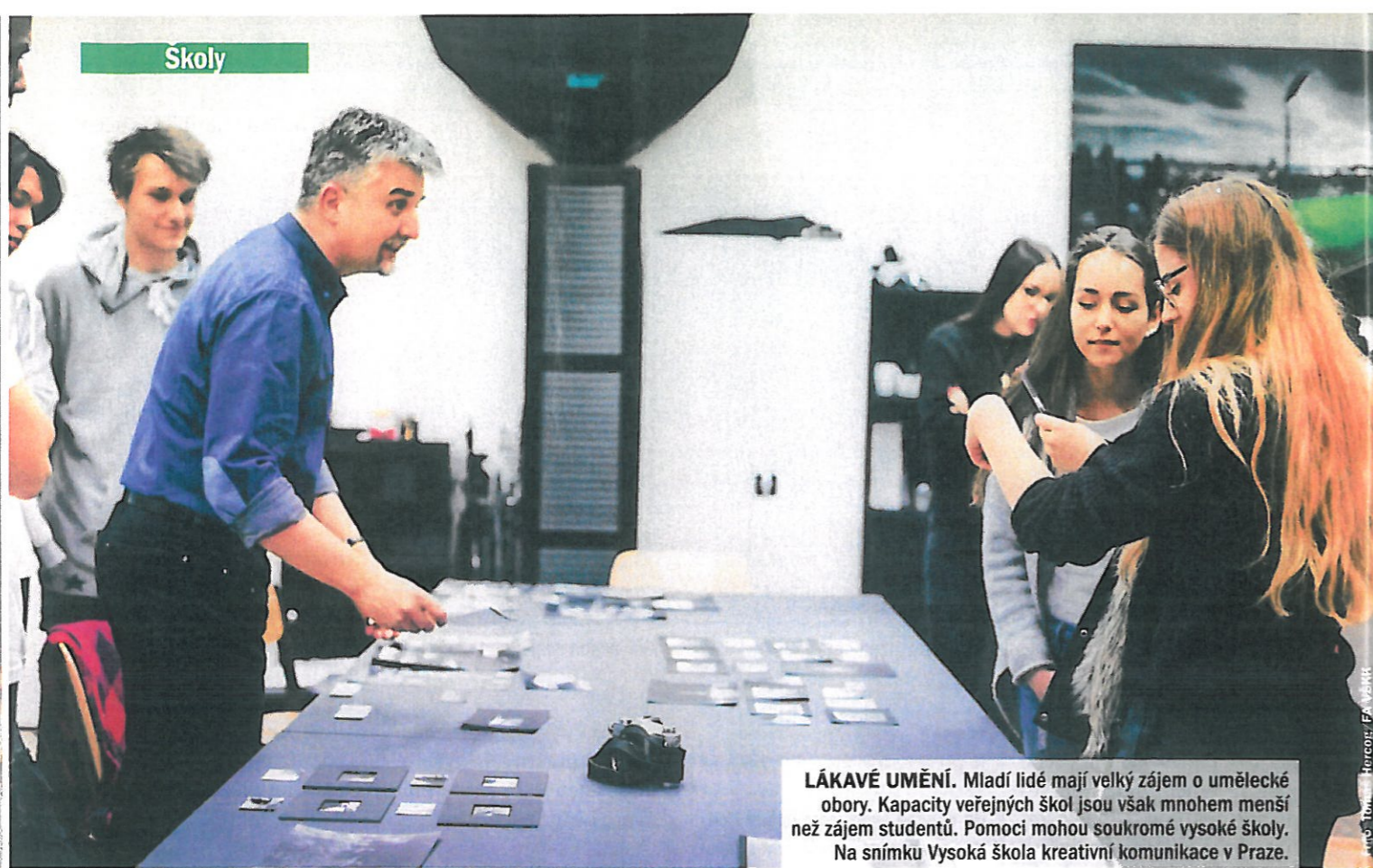
LÁKAVÉ UMĚNÍ. Mladí lidé mají velký zájem o umělecké obory. Kapacity veřejných škol jsou však mnohem menší než zájem studentů. Pomoci mohou soukromé vysoké školy. Na snímku Vysoká škola kreativní komunikace v Praze.